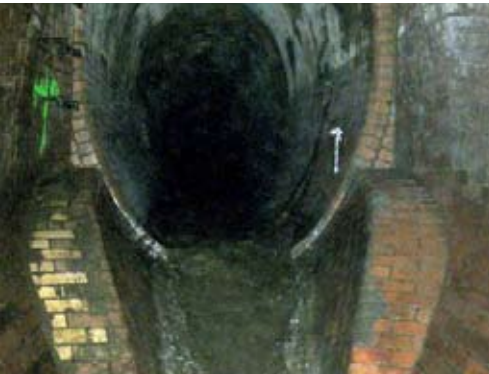
Abb. 2 Die ursprüngliche sogenannte Froschmaul-Entlastungskammer