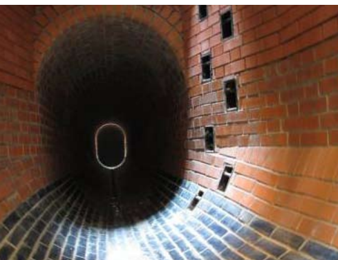
Abb. 5 Anschluss an den Abwasserkanal „K“ (Querschnitt 1200/1800 mm)