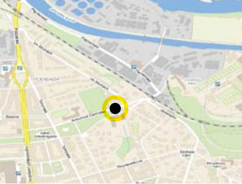
Abb. 1 Position der neuen Entlastungskammer in Prag-Bubeneč