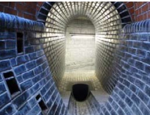
Abb. 3 Einlauf in die Kammer über Rohrabsturz