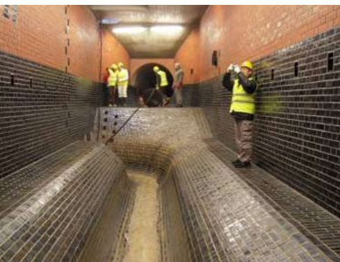
Abb. 4 Schmutzwasserdurchfluss in der Kammer